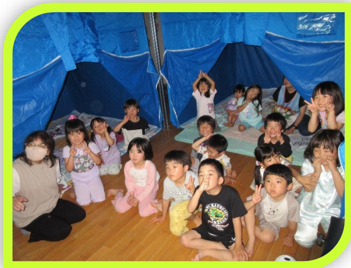
就寝前に記念撮影