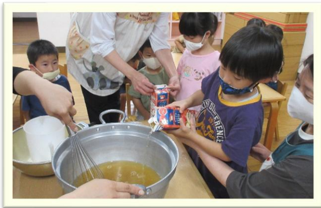
デザートのリンゴゼリー作り