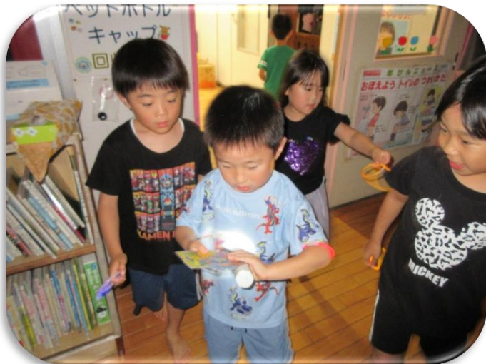
暗闇の中での宝探しゲーム