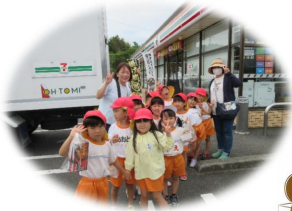
みんなで歩いてお買い物