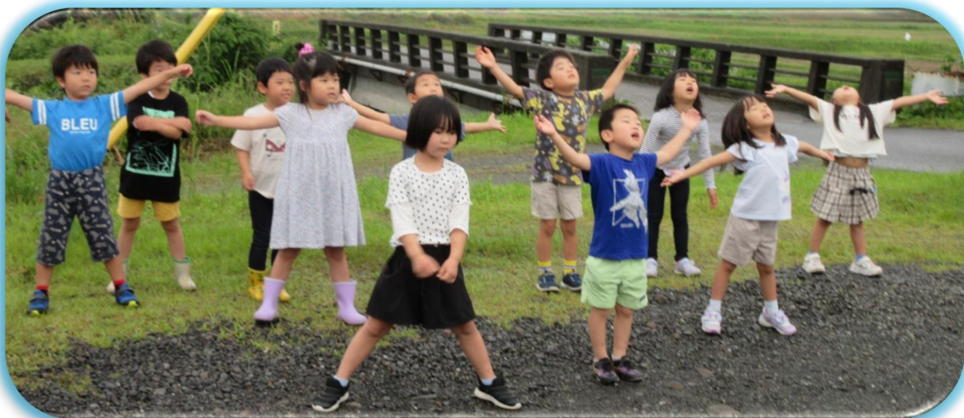
雨上がりに朝の体操